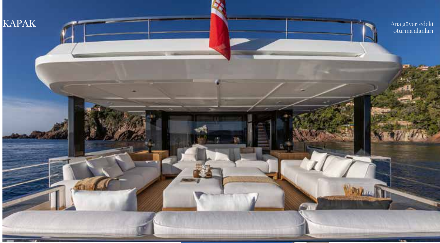
Ana güvertedeki oturma alanları