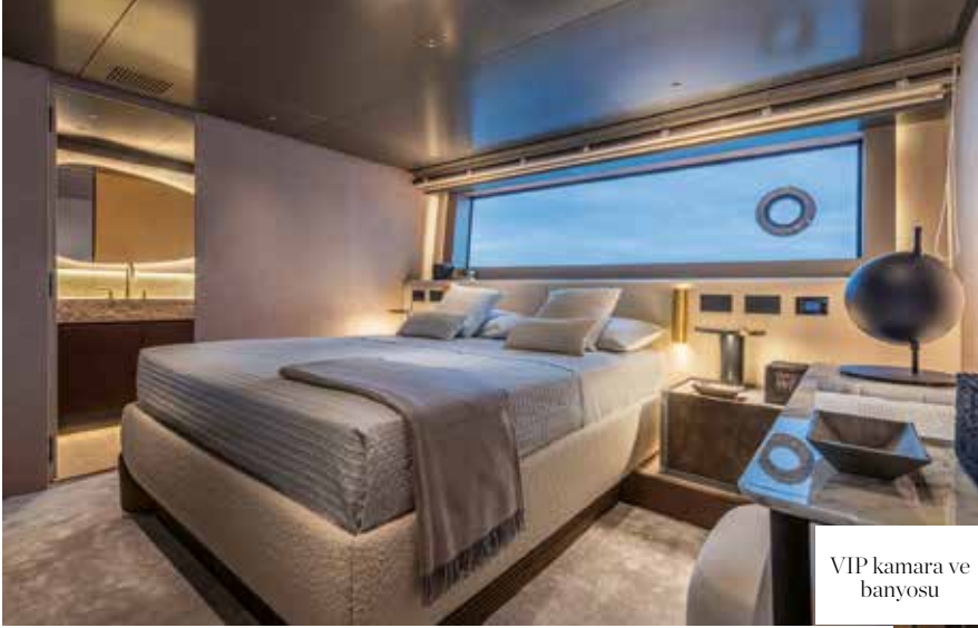
VIP kamara ve banyosu