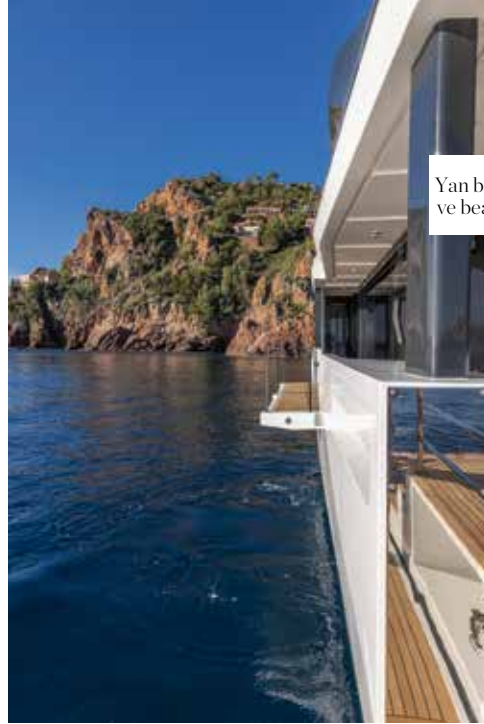
Yan balkonlar ve beach club

Yüzme platformundan pruvaaya kadar tüm alanlar kesintisiz bir şekilde akıp giden bir ahenge sahip. Bu planlama sayesinde yat sahibi ana güvertenin cıvı cıvı ortamının, üst güvertenin daha kişiselleştirilmiş köşelerinin ve pruva alanında yaratılmış tam mahremiyet hissini tadım çıkarabiliyor. Kayar kapı sistemleri ana ve üst güvertelerde çok yönlü yaşam alanlarını birbirine bağlıyor. Bu kısımlarda, yan ve arka duvarlar komple açılarak bu ortamların açık hava alanlarına dönüştürülmesi mümkün oluyor.