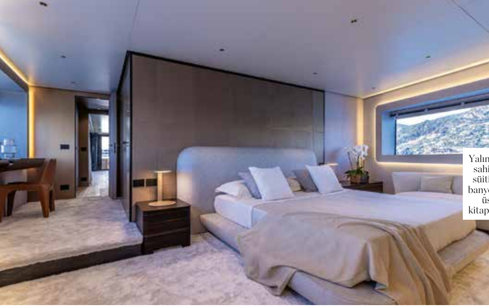
Yalın bir şıklığa sahip master süit'in (solda) banyosu (sağda üstte) ve kitaplığı (altta).