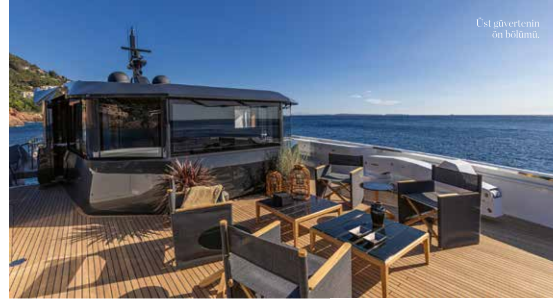
Üst güvertenin ön bölümü.