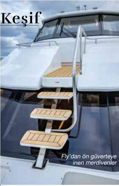
Fly'dan ön güverteye inen merdivenler