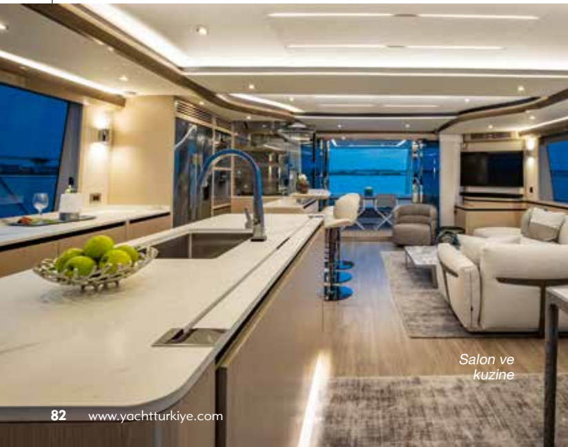
Salon ve kuzine