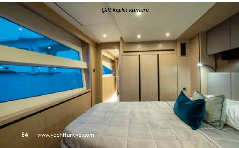
Çift kişilik kamara

Yakıt kapasitesi 4.400 lt Tatlı su kapasitesi 1.560 lt Kamara 4/5/6 Motor 2x1000 HP Volvo Penta D-13 İletişim www.tezmarin.com