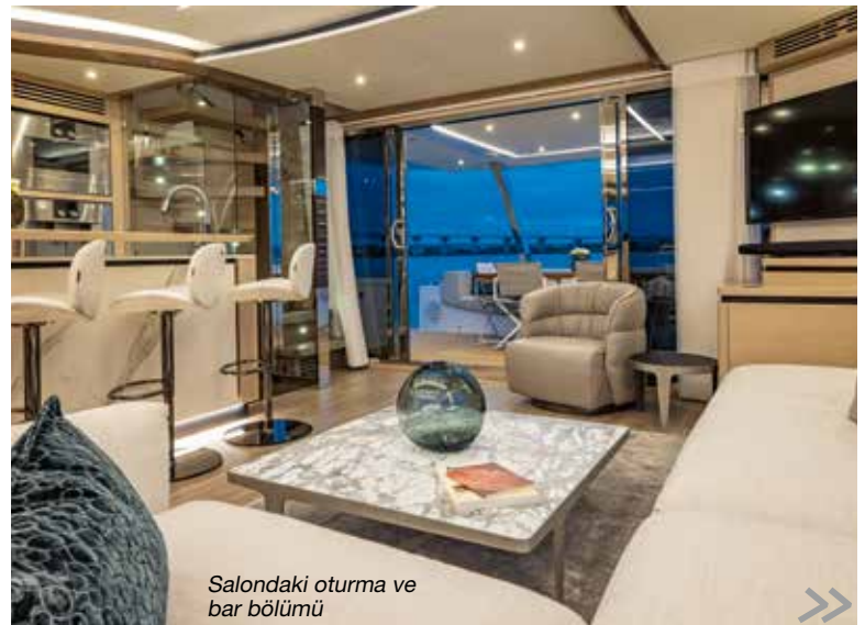
Salondaki oturma ve bar bölümü