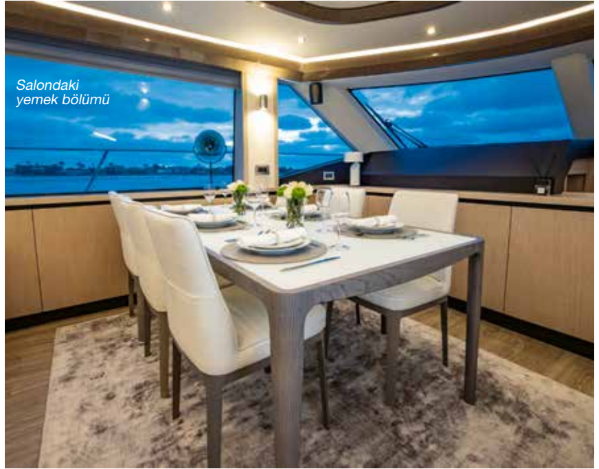
Salondaki yemek bölümü

Mutfak alanı salona oldukça zekice entegre edilmiş. Detaylardaki lüks dokunuşlar, kullanışlı depolama alanları, zarif mobilyalar, hepsi teknede geçirilen her bir günde, ister aile üyeleriyle olsun ister misafirlerle onlardan ayrı zaman geçirmeden hep bir arada olunabilecek mekânlar yaratılması sağlanmış. Aquila 70 Luxury'nin cömert yerleşim seçenekleri arasında mutfakın aşağıda olduğu düzen de ayrıca seçenekler arasında sunuluyor.